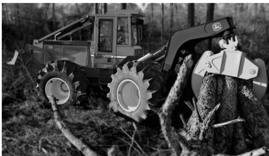
Рис. 2. Скиддер 648 G-III фирмы John Deere с пачковым захватом