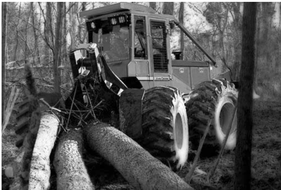
Рис. 1. Скиддер 640 G-III фирмы John Deere с канатно-чokerной оснасткой

Технологическое оборудование. По типу оснащаемого технологического оборудования КТМ разделяют на две группы. Это классический вариант с канатно-чokerным оборудованием (рис. 1) и бесчokerные машины с пачковым захватом (рис. 2). В последние годы начинает формироваться также третья группа машин, оснащенных гидроманипулятором.