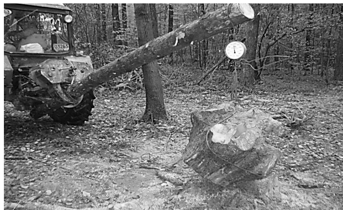
Рис. 3. Определение массы центральной части корневой системы

Помимо определения объема керна подземной части, определяли и общую массу и массу керна корневой системы (рис. 3).