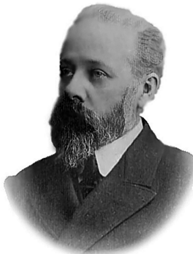
Г.Ф. Морозов (1867–1920 гг.)

Продолжая и развивая лучшие традиции, накопленные за 190 лет существования, современный «Лесной журнал» охватывает все направления лесного хозяйства, лесной, деревообрабатывающей и целлюлозно-бумажной промышленности, освещает экологические проблемы. «Лесной журнал» входит в перечень изданий, рекомендуемых ВАК для публикации научных статей соискателей ученых степеней, включен в реестры международных баз данных: Emerging Sources Citation Index (Web of Science Core Collection), Russian Science Citation Index (RSCI), Ulrichsweb Global Serials Directory, EBSCO, AGRIS, Chemical