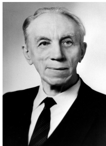
И.С. Мелехов (1905–1994 гг.)